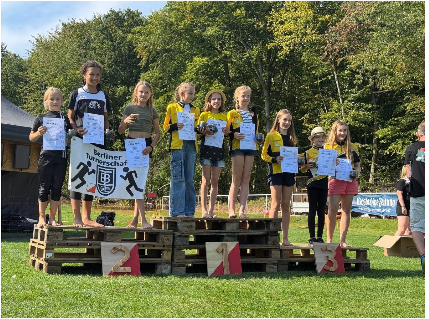
Deutsche Bestenkämpfe Mannschafts-0L_24 D12-Team