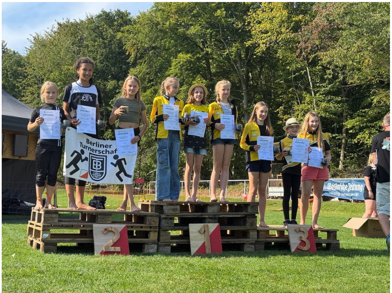
Deutsche Bestenkämpfe Mannschafts-OL_24 D12-Team

Bericht von Pina, mit viel Platz für eure Foto`s ☐