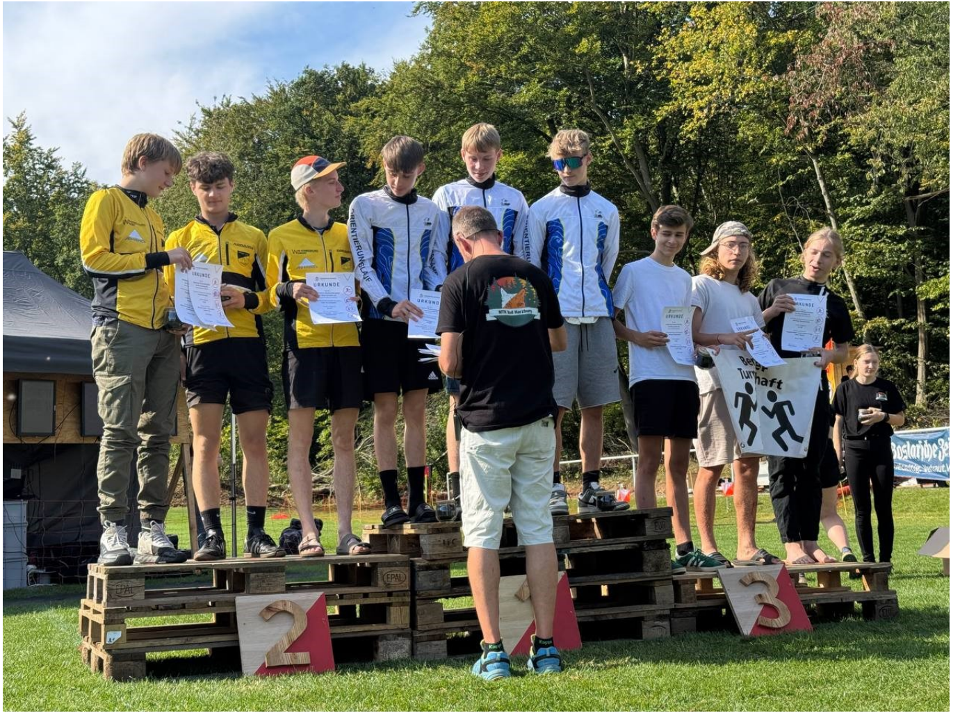
DBK Mannschafts OL H18-Team