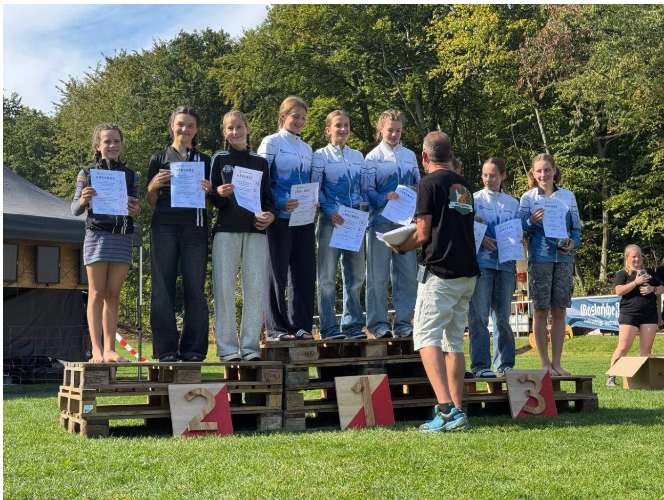
D14-Team bei der DM Staffel OL 2024