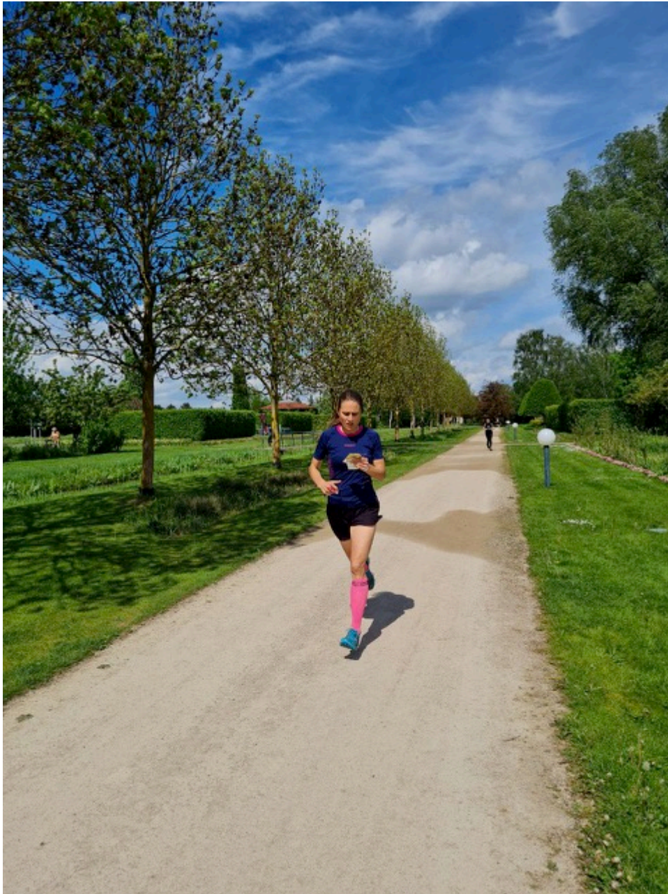
BM_Sprint_0L am 5.5.24