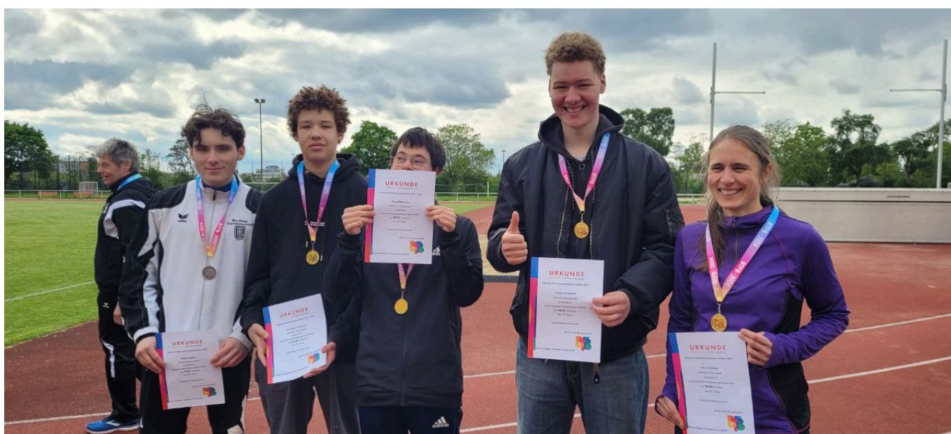
BMKM, LA 5-Kampf am 20.04.2024