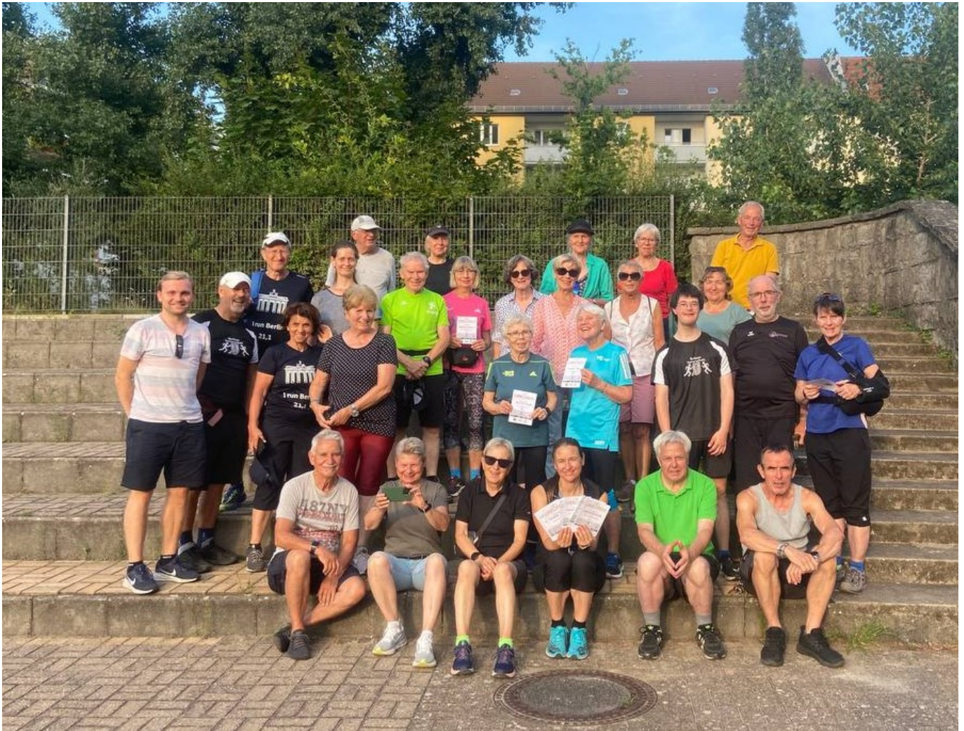
DLV WalkingAbzeichen Freitag, 19.Juli 20.24