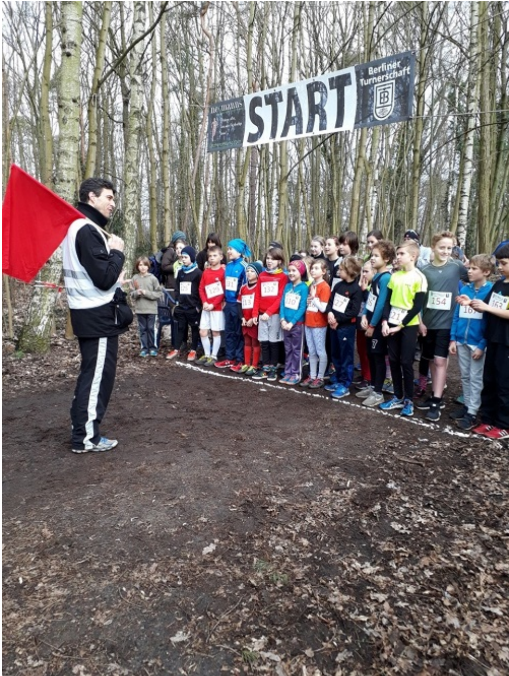
Fotos BT-Meile 2016