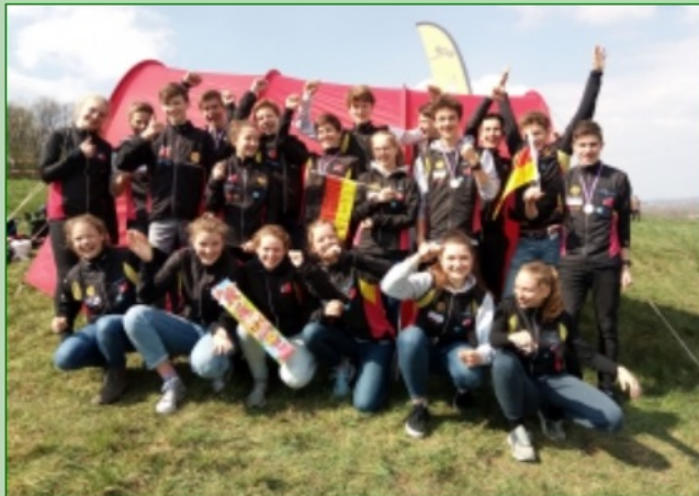
CYEOC-Team 2019

Nach Vorschlag des Trainerrats hat der TK-Vorsitzende Steffen Lösch den Nachwuchskader 2020 berufen. Insgesamt 28 Jugendliche aus acht Landesverbänden werden dem Team angehören und Anfang Januar in Bad Kreuznach gemeinsam in die Saison starten.