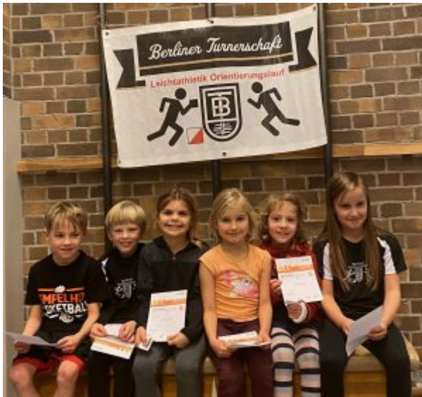
BT LA Nachwuchs bei der Sportabzeichenverleihung