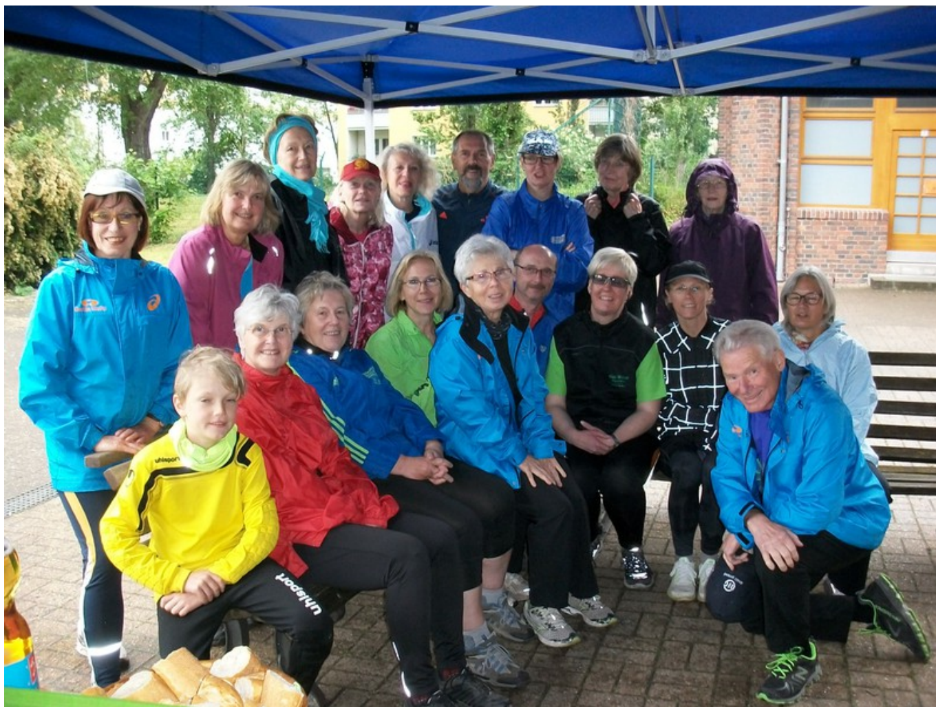
DLV Walkingabzeichenabnahme 2015