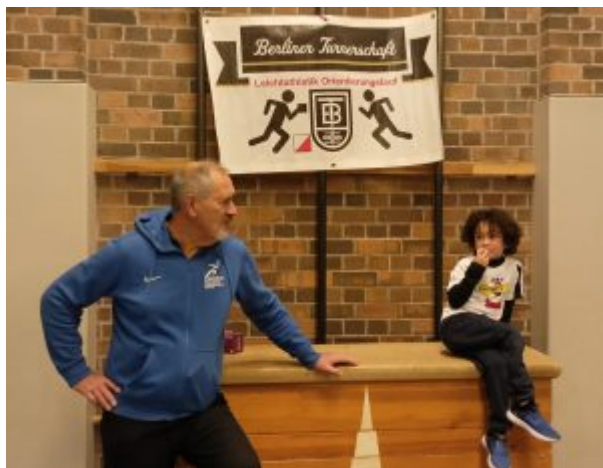
BT LA Neujahrsfeier24

BT_8.März BT-LA Abteilungsversammlung, siehe PDF Tagesordnung/ Einladung BT-LA-Jahreshauptversammlung24