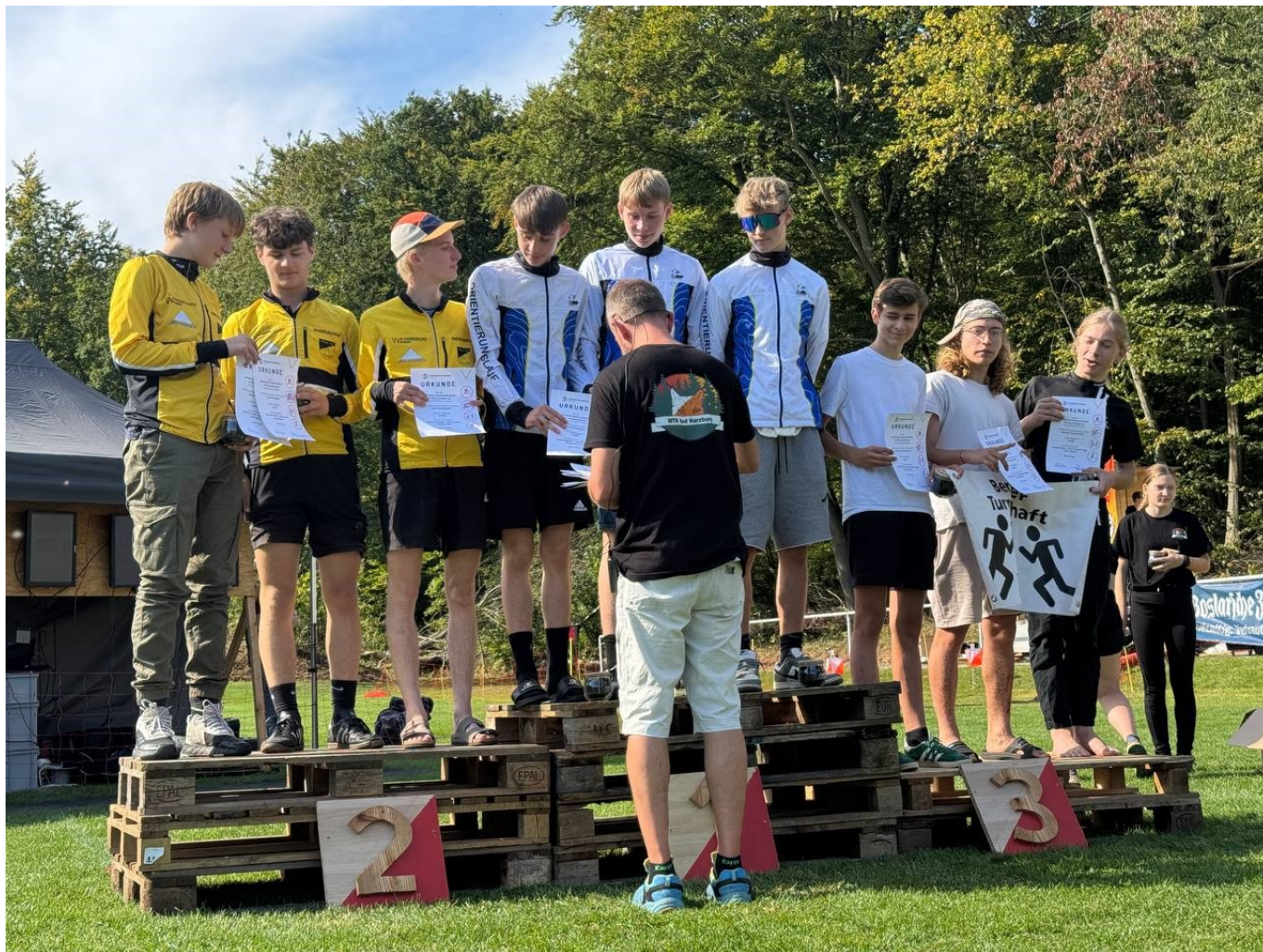
DBK Mannschafts OL H18-Team