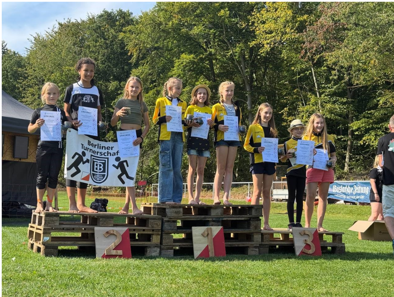
Deutsche Bestenkämpfe Mannschafts-0L_24 D12-Team