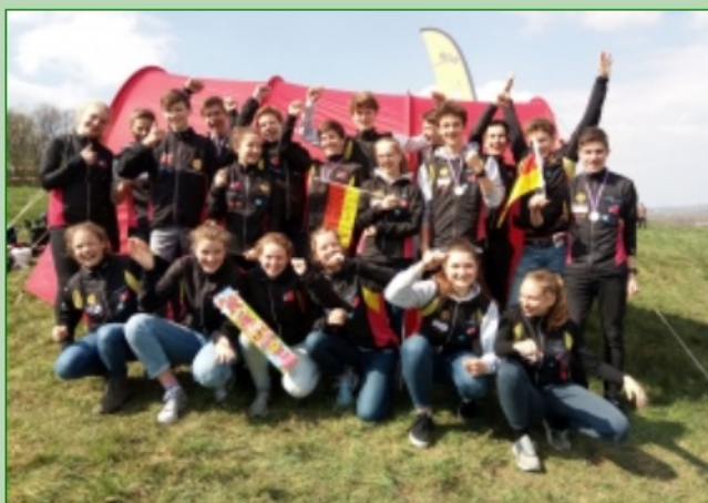
CYEOC-Team 2019

Nach Vorschlag des Trainerrats hat der TK-Vorsitzende Steffen Lösch den Nachwuchskader 2020 berufen. Insgesamt 28 Jugendliche aus acht Landesverbänden werden dem Team angehören und Anfang Januar in Bad Kreuznach gemeinsam in die Saison starten.