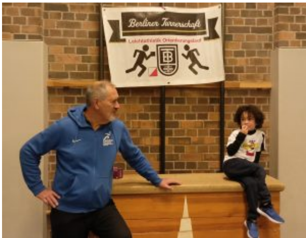
BT LA Neujahrsfeier24

BT_8.März BT-LA Abteilungsversammlung, siehe PDF Tagesordnung/ Einladung BT-LA-Jahreshauptversammlung24