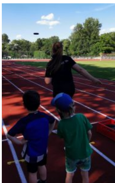
Station Weitwurf, der