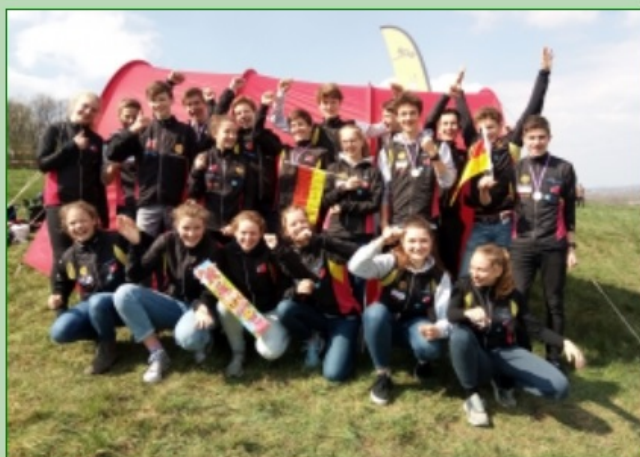
CYEOC-Team 2019

Nach Vorschlag des Trainerrats hat der TK-Vorsitzende Steffen Lösch den Nachwuchskader 2020 berufen. Insgesamt 28 Jugendliche aus acht Landesverbänden werden dem Team angehören und Anfang Januar in Bad Kreuznach gemeinsam in die Saison starten.