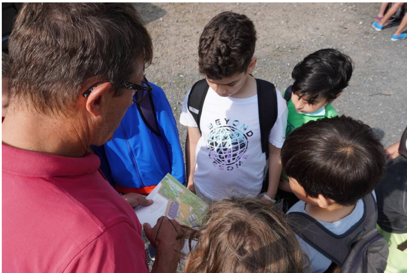
Schul-OL 22, Trainingsvorbereitungen

BT- Bambiniwettkampf 6. Juli 2022, bei uns sind alle Gewinner*innen :)