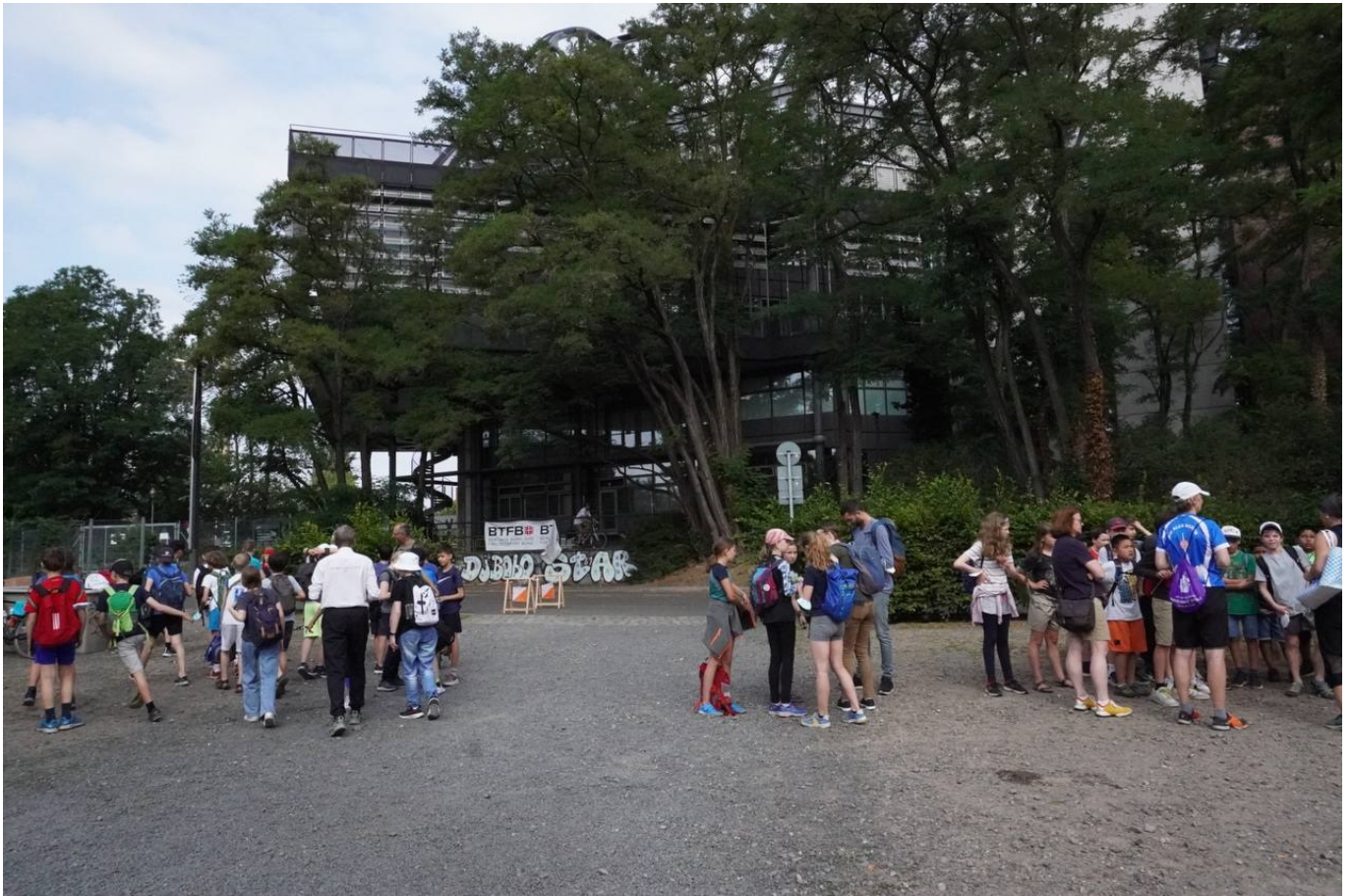
Schul-OL 22, Ehrenamtliche Sportler*innen verschiedener Vereine geben eine Einweisung in die Sportart Orientierungslauf . Im Hintergrund ist das Ziel zu sehen.