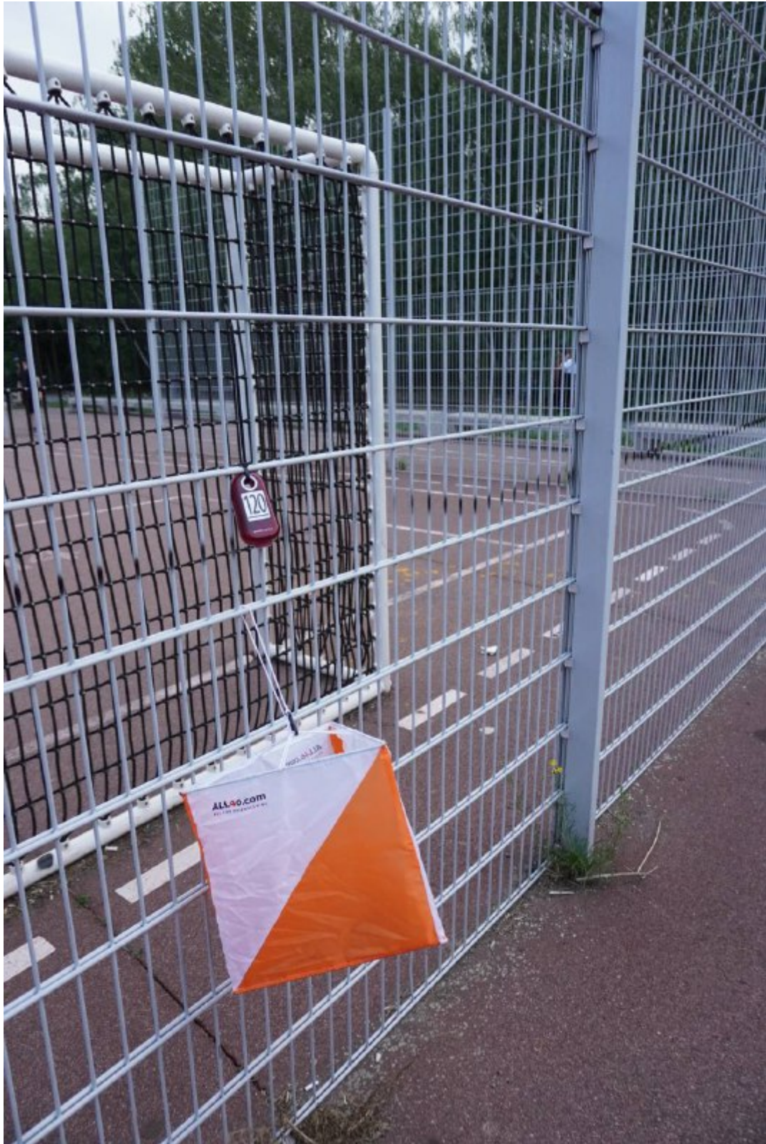
Schul-OL 22, Orientierungslaufposten Nummer 120, Foto: P. Mauch,