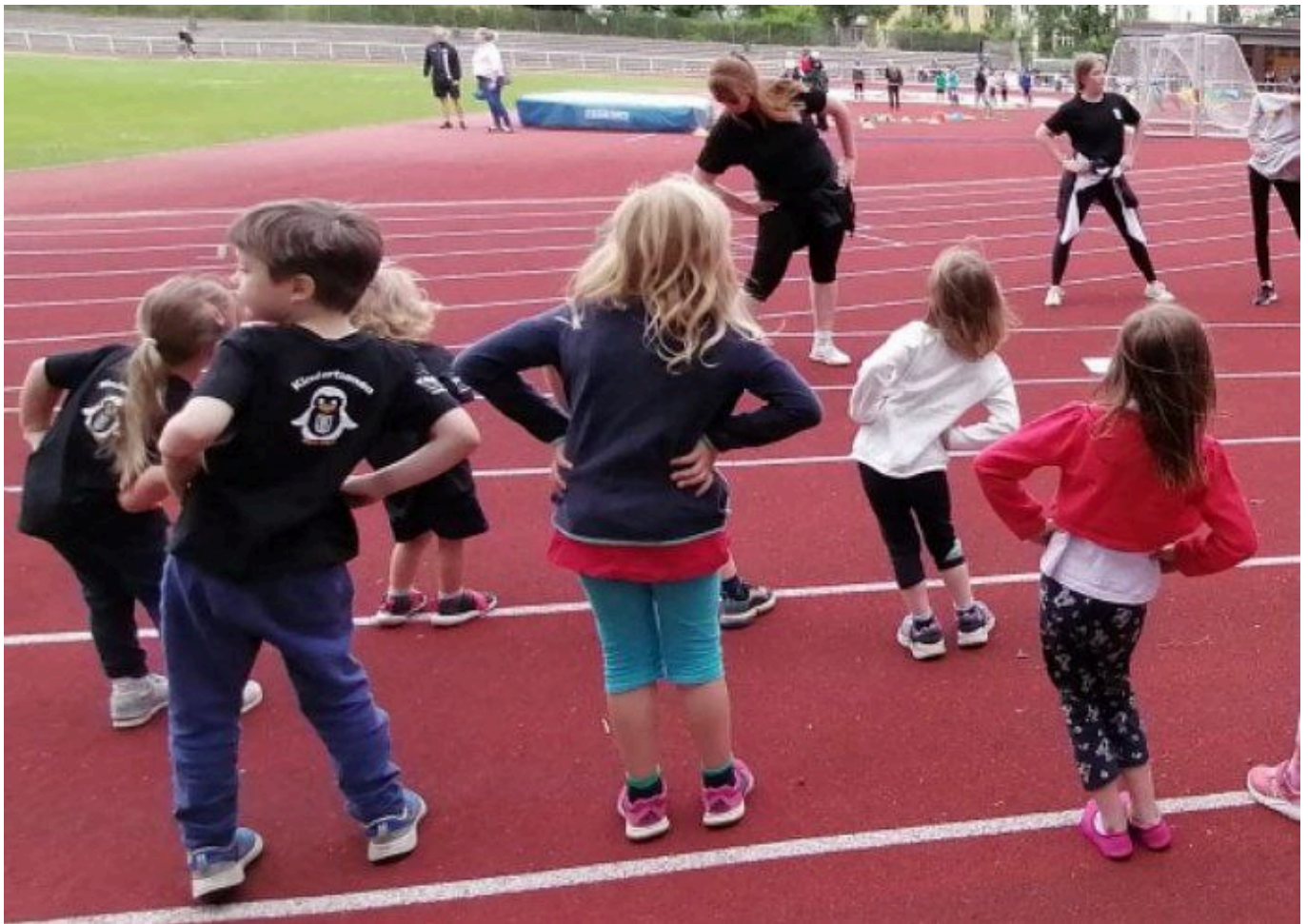
Bambiniwettkampf 22, BT-Kinder beim Warm Up

Nachdem uns unser Sportfest für den BT-LA-Nachwuchs nach dem Schul-OL am Freitag Nachmittag (1.7.) sprichwörtlich weggeschwommen ist, wurden wir am traditionellen letzten Trainingsmittwoch mit Traumwetter zum Bambiniwettkampf belohnt. 75 Kinder anderer BT-Abteilungen nahmen am Wettbewerb teil und zeigten sich gut gelaunt, fit und bestens vorbereitet. Der LA-Nachwuchs betreute die einzelnen Stationen und unsere Kinder der Schul-AG sowie eine große Gruppe der jüngeren LA-Athleten*innen nahm ebenfalls am Wettbewerb teil.