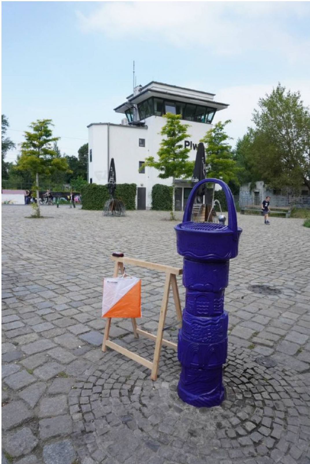
Schul-OL 22, Postenstandort am Trinkbrunnen, im Hintergrund das Stellwerk im Park Gleisdreieck, Foto: P. Mauch,