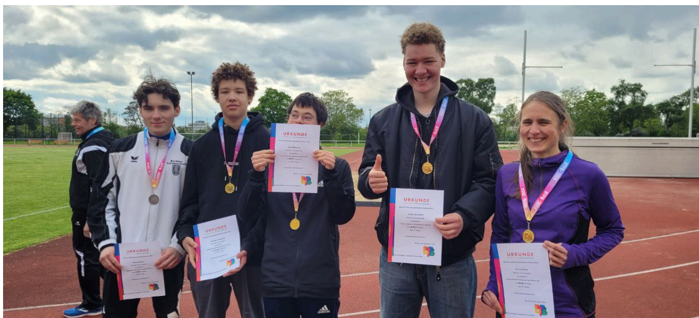
BMKM, LA 5-Kampf am 20.04.2024