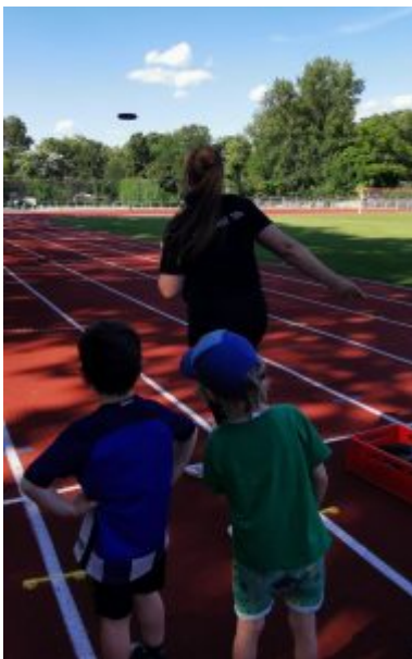
Station Weitwurf, der große Wurf! „Uuufuu“

Wir wünschen alle schöne Ferien und bedanken uns ganz herzlich bei allen großen und kleinen Sportfans und bei allen die zum Gelingen beigetragen haben!