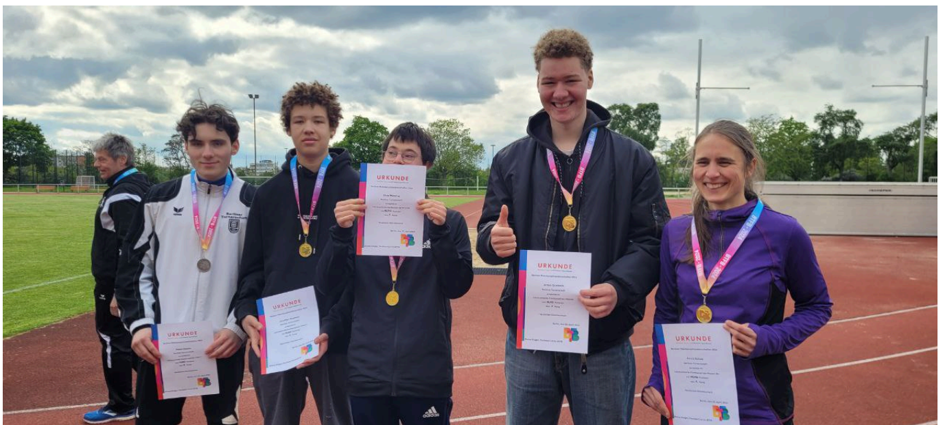
BMKM, LA 5-Kampf am 20.04.2024