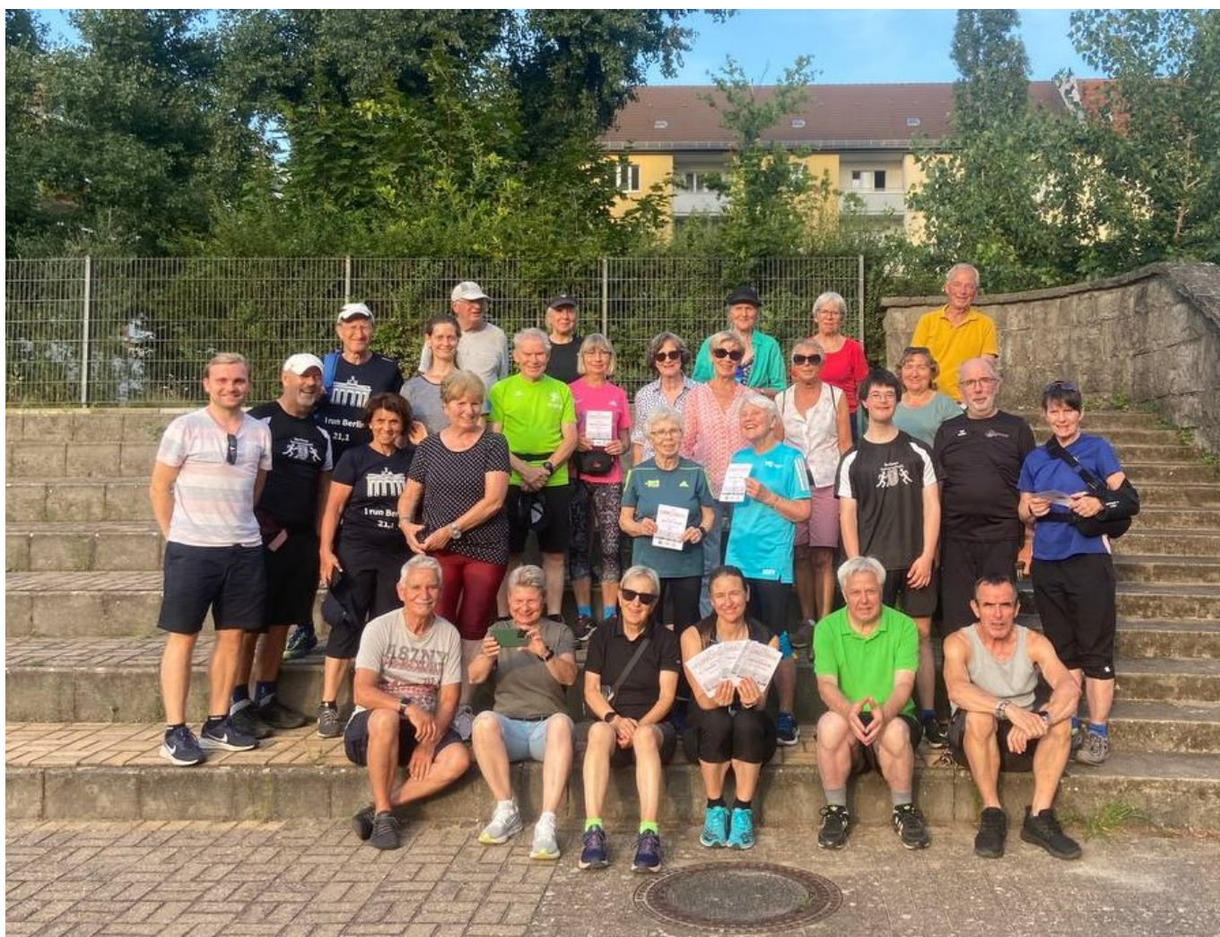
DLV WalkingAbzeichen Freitag, 19.Juli 20.24