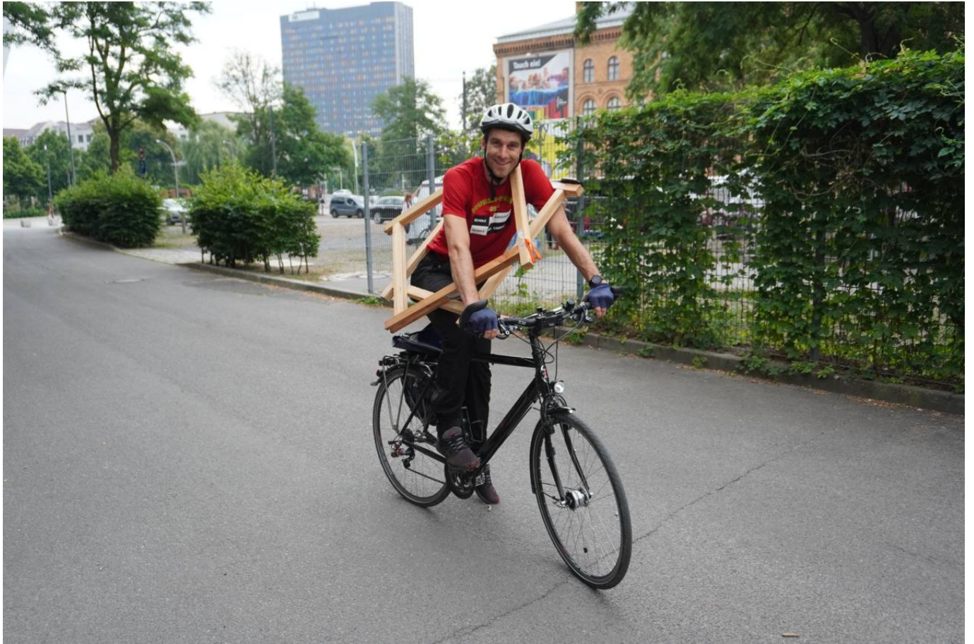
Schul-OL 22, Helfer beim Aufbau