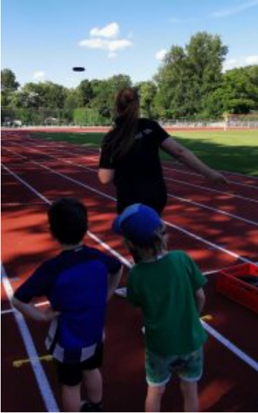
Station Weitwurf, der große Wurf! „Uuufooo“

Wir wünschen alle schöne Ferien und bedanken uns ganz herzlich bei allen großen und kleinen Sportfans und bei allen die zum Gelingen beigetragen haben!