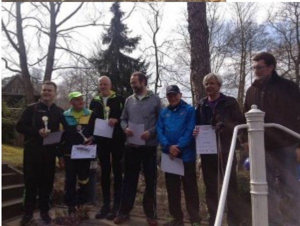
Fotos BT-Meile 2014