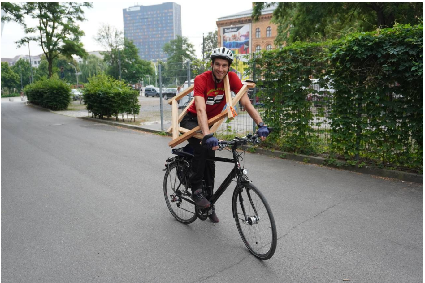
Schul-OL 22, Helfer beim Aufbau, Foto: P. Mauch

Das BT-LA-Team sagt herzlichen Dank an alle fleißigen Helfer*innen, danke für alle Materialleihgaben und Zuarbeiten & natürlich vielen Dank für eure Rege Teilnahme, wir wünschen allen kleinen und großen Sportler*innen schöne Ferien!