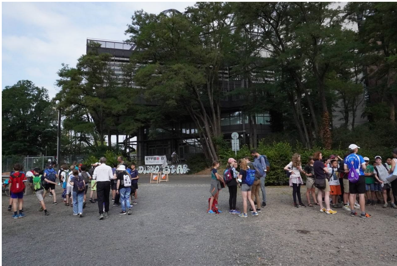
Schul-OL 22, Ehrenamtliche Sportler*innen verschiedener Vereine geben eine Einweisung in die Sportart Orientierungslauf . Im Hintergrund ist das Ziel zu sehen., Foto: P. Mauch,