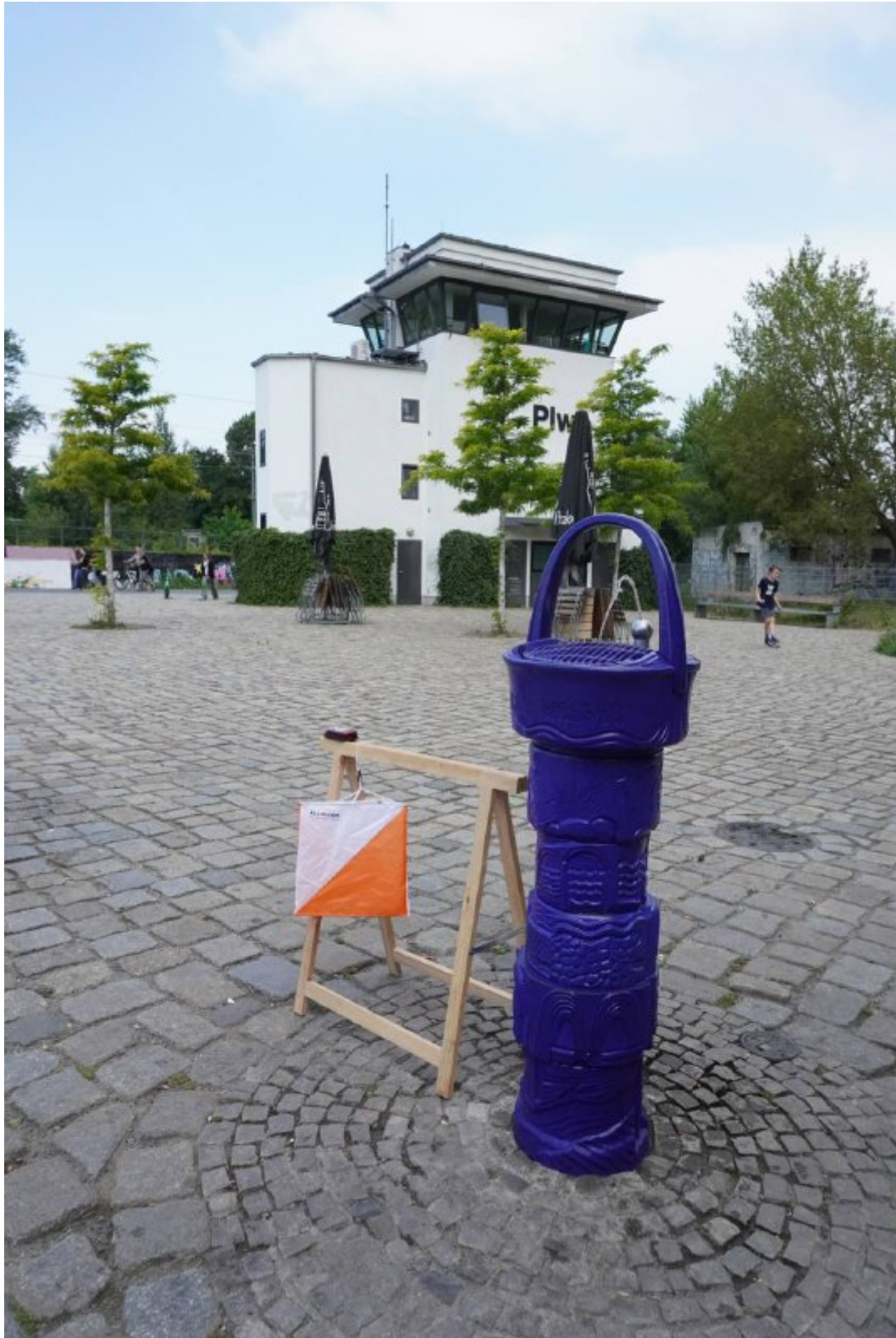
Schul-OL 22, Postenstandort am Trinkbrunnen, im Hintergrund das Stellwerk im Park Gleisdreieck, Foto: P. Mauch,