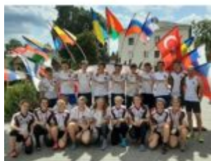
Das deutsche Nachwuchsteam bei ihrem früheren Einsatz